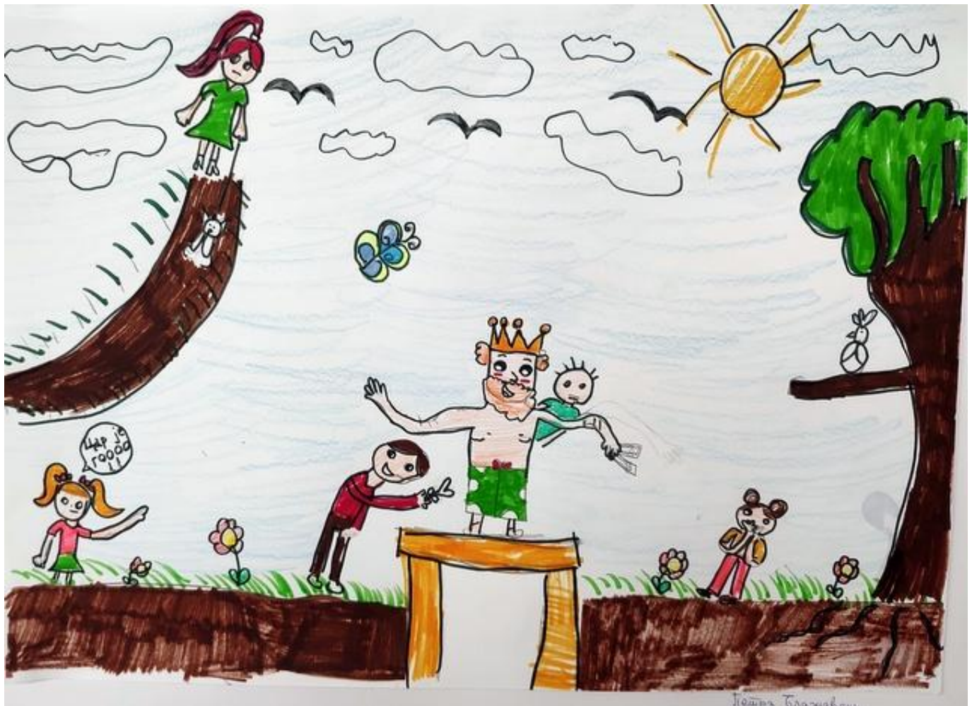
Петра Блажевски Ц4