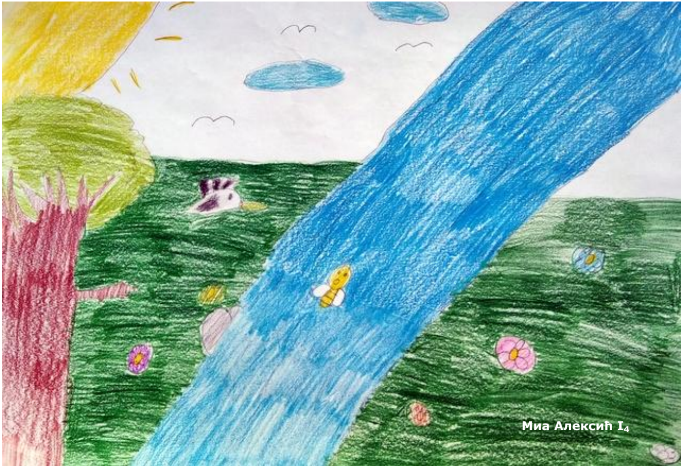
Миа Алексић 14