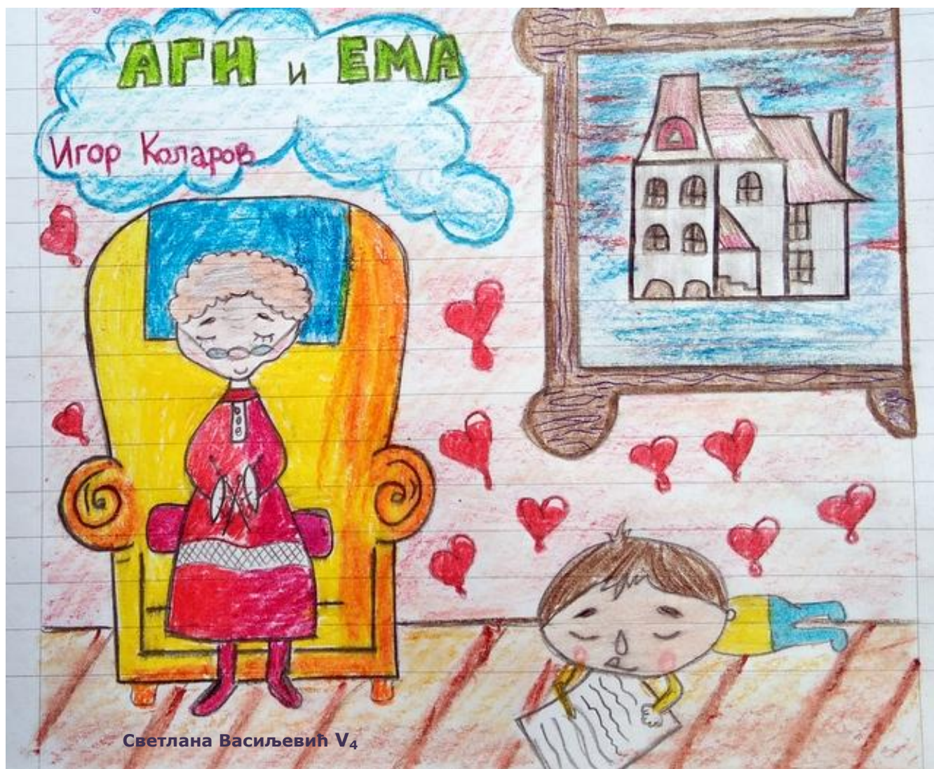
Светлана Васиљевић V 4