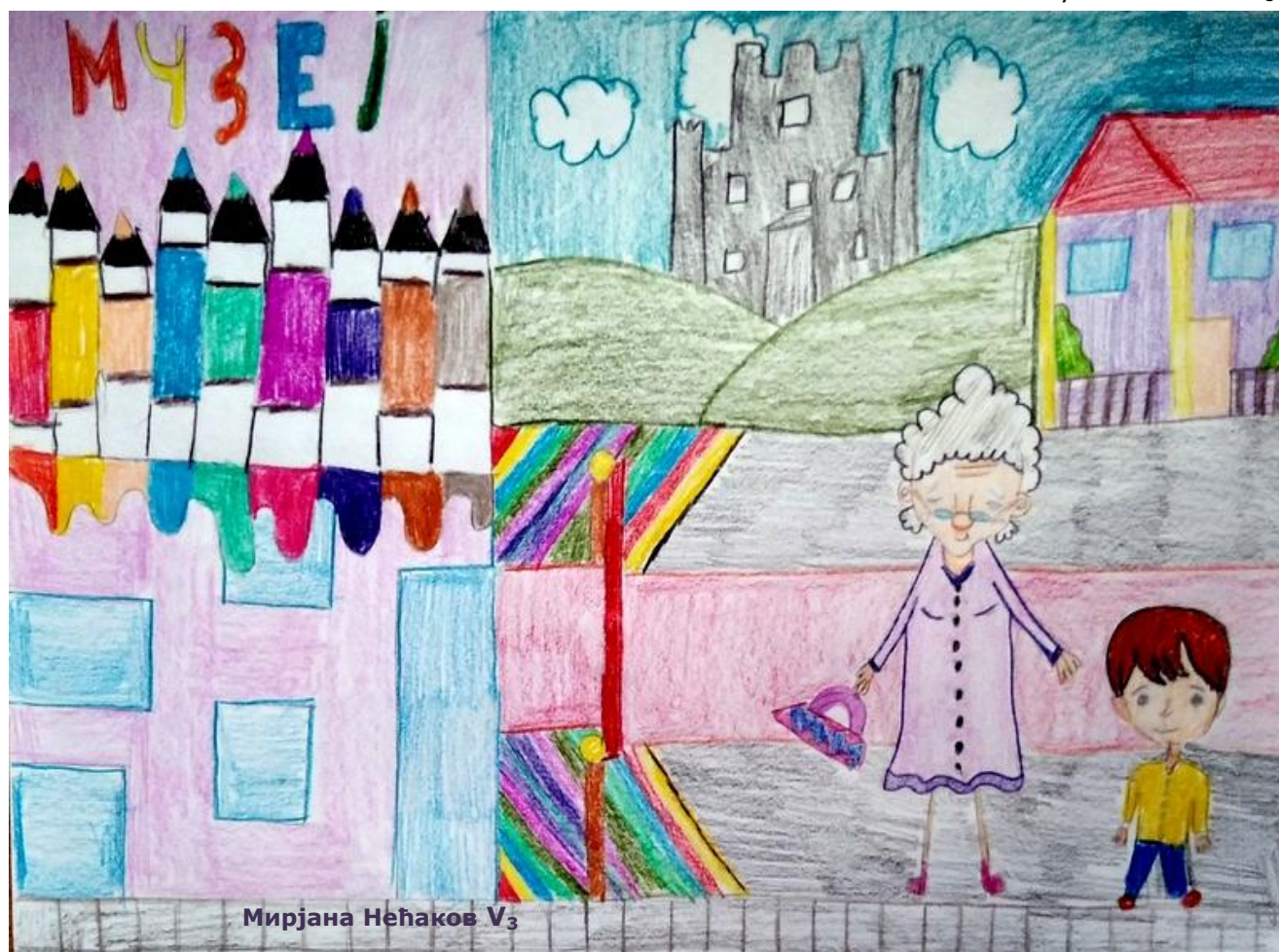
Мирјана Нећакoв V 3