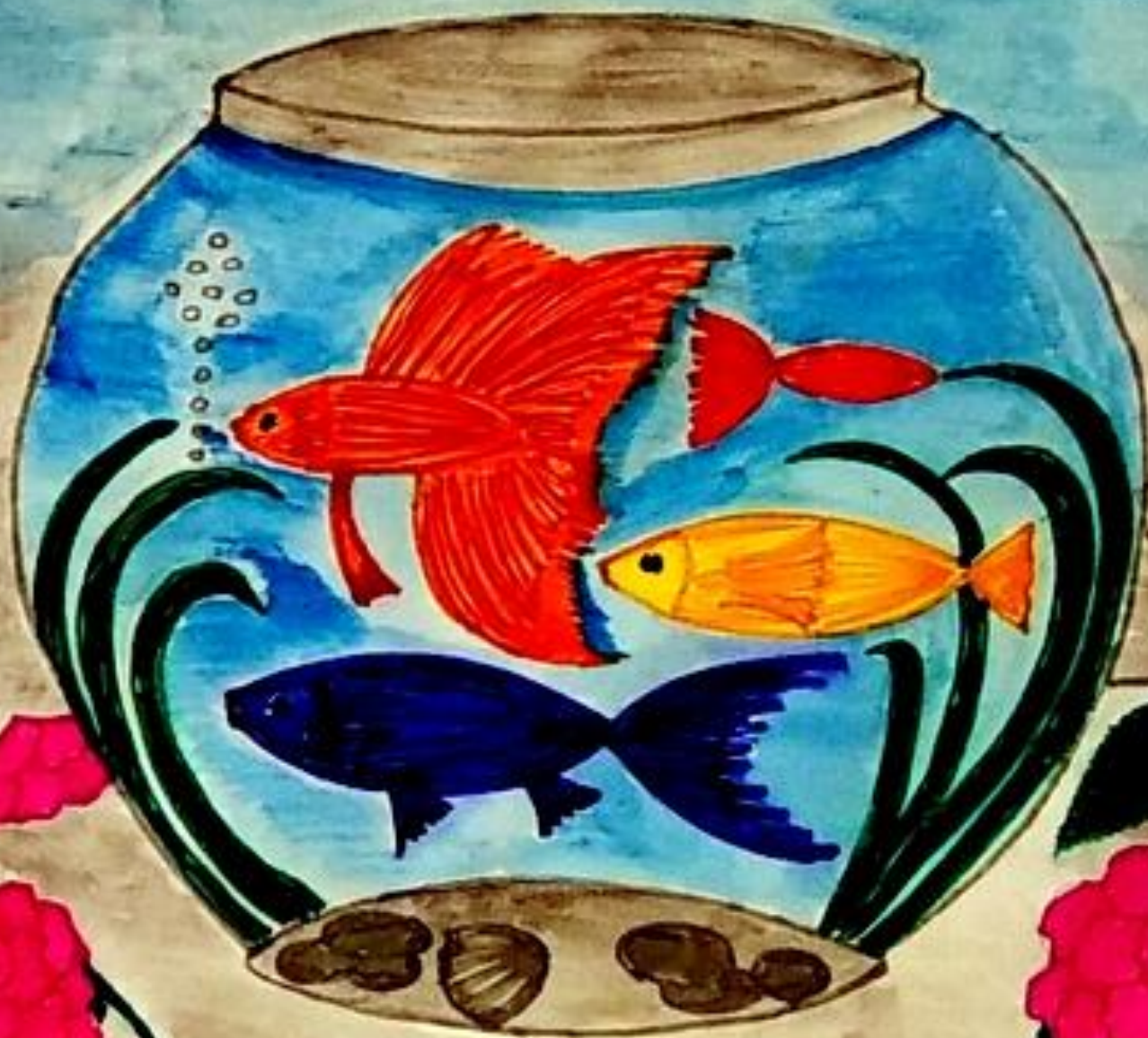
„Акваријум“ Ања Адашевић IV 5