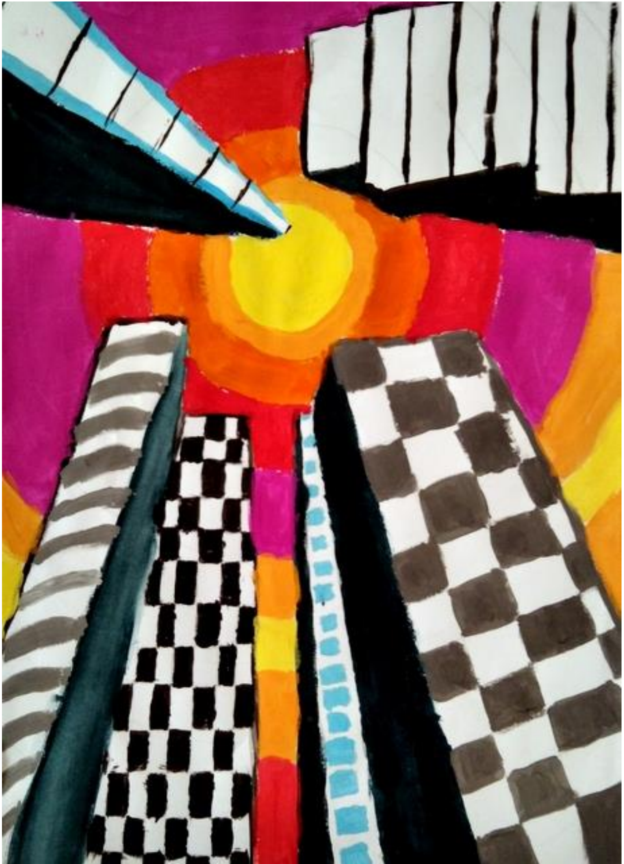
Ања Поповић IV 3