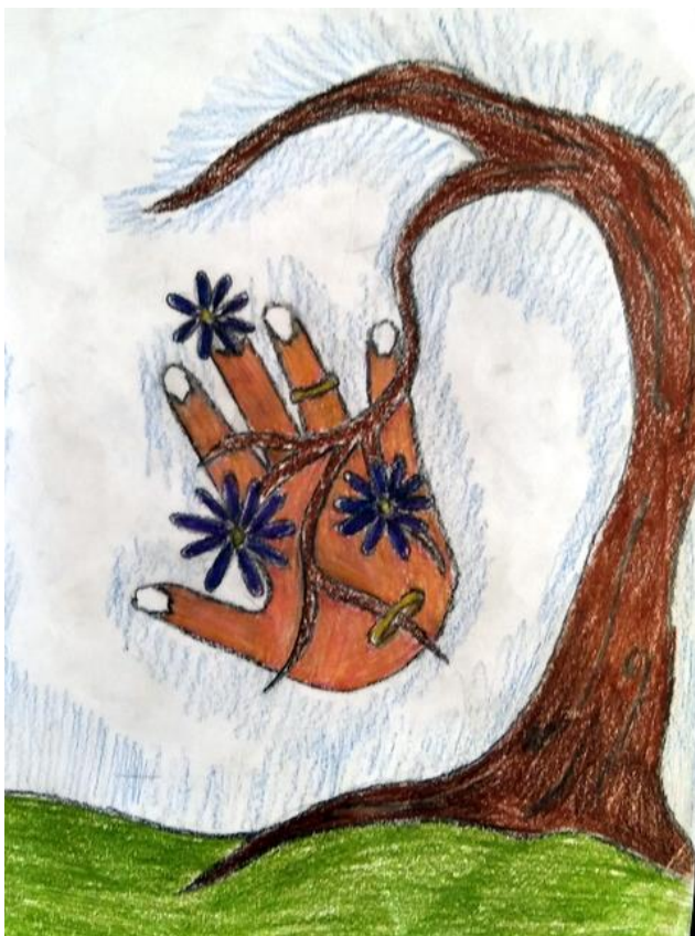
Матеј Цветковић V 3