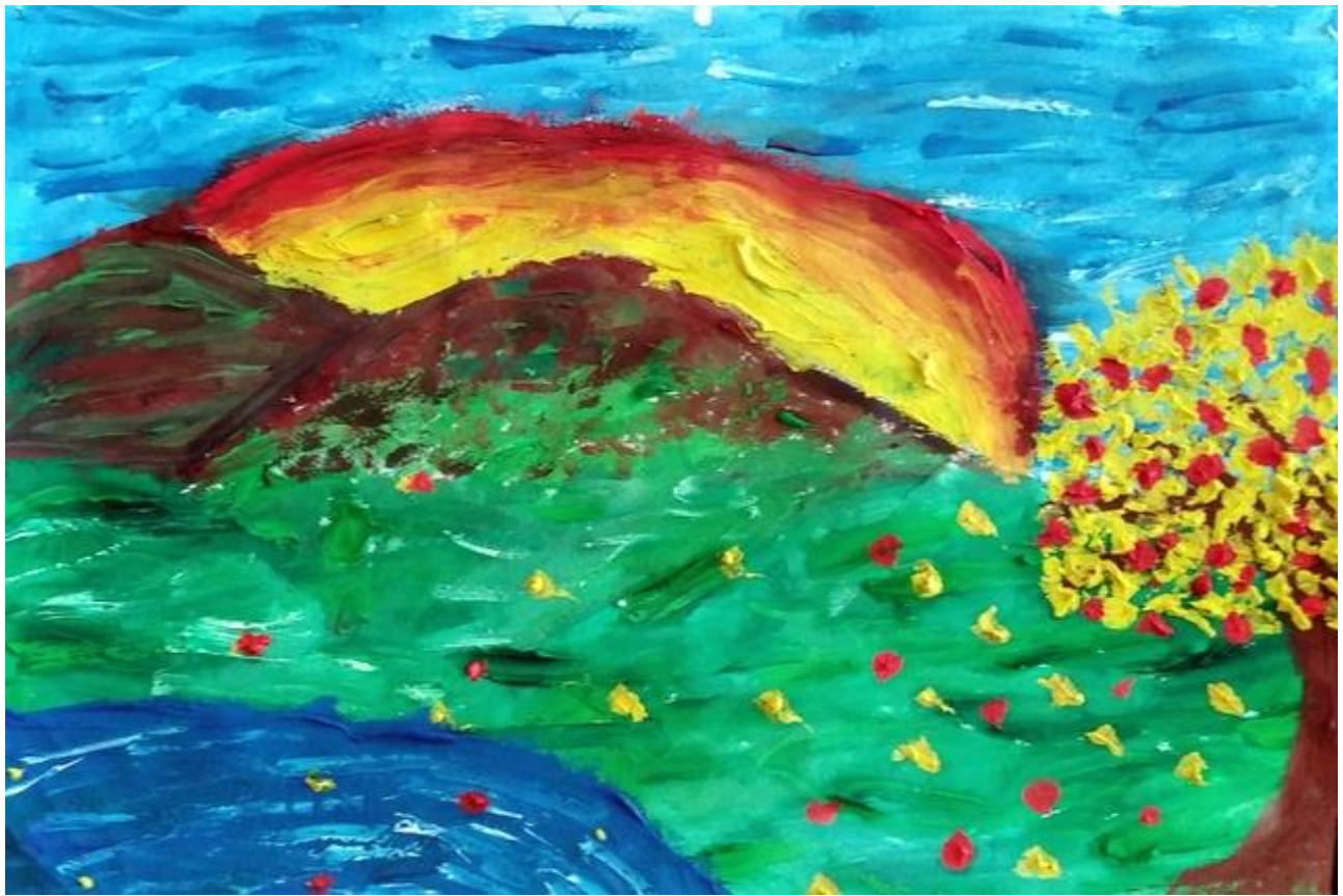
Сара Гмитровић VII 1