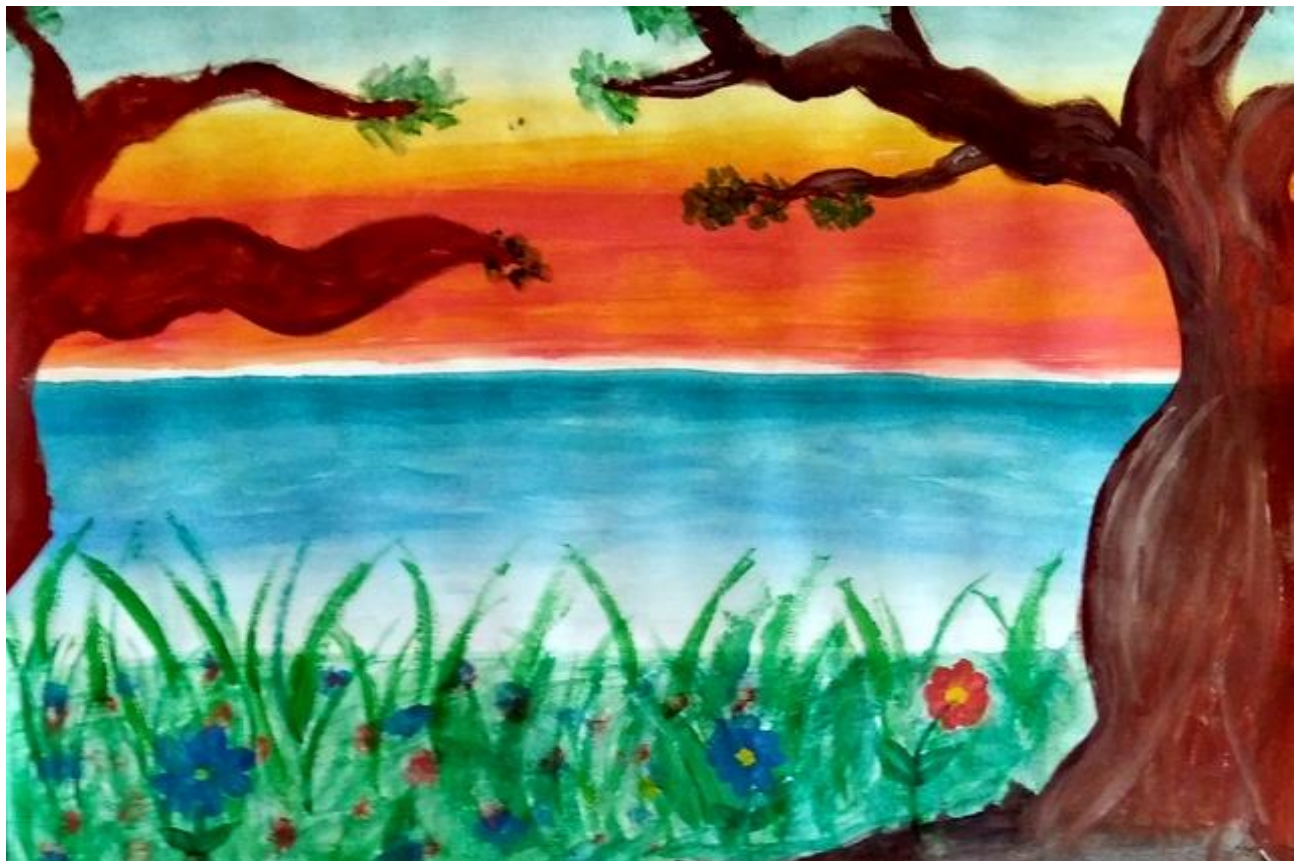
Петра Голубовић VII 1