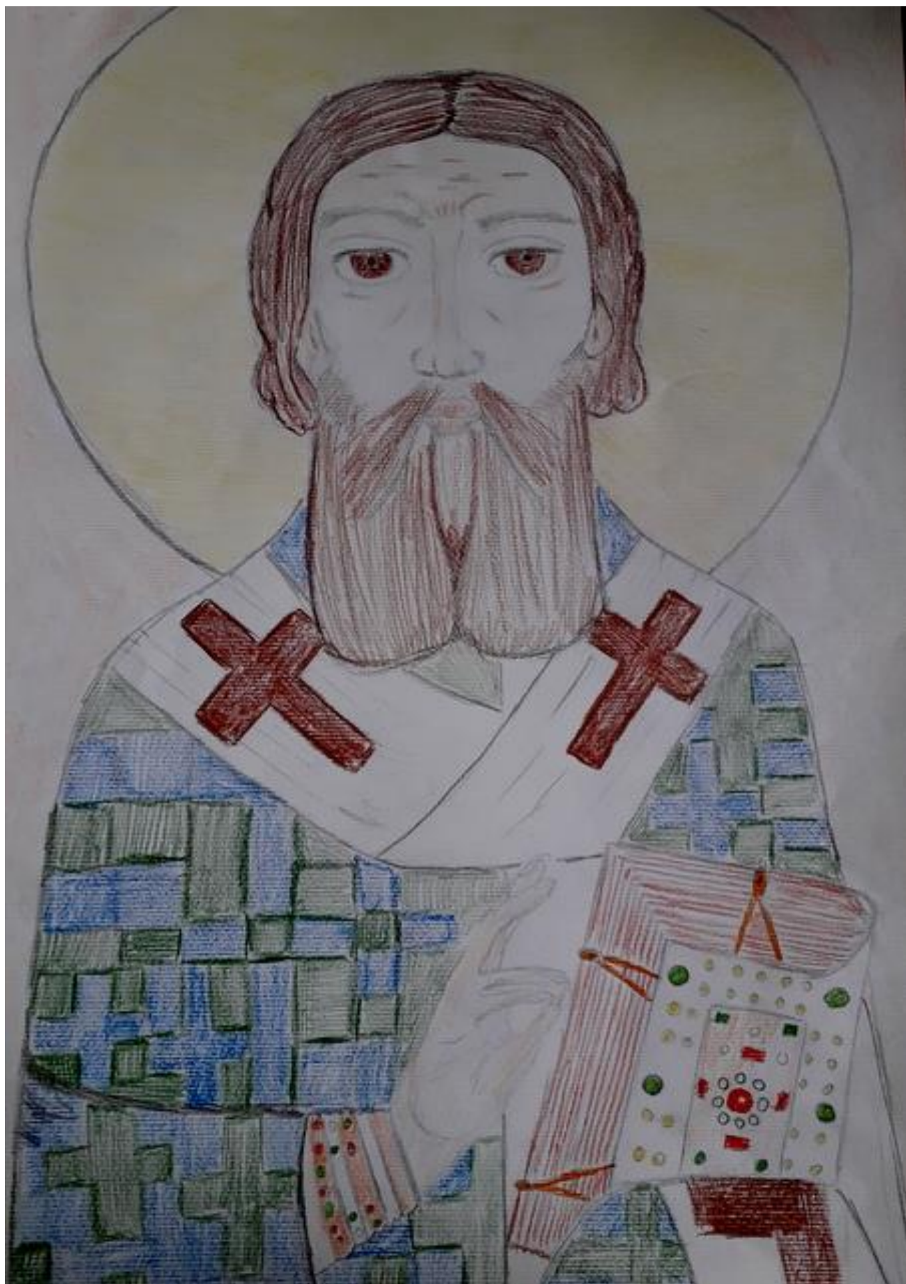
Стефан Вукелић IV 4