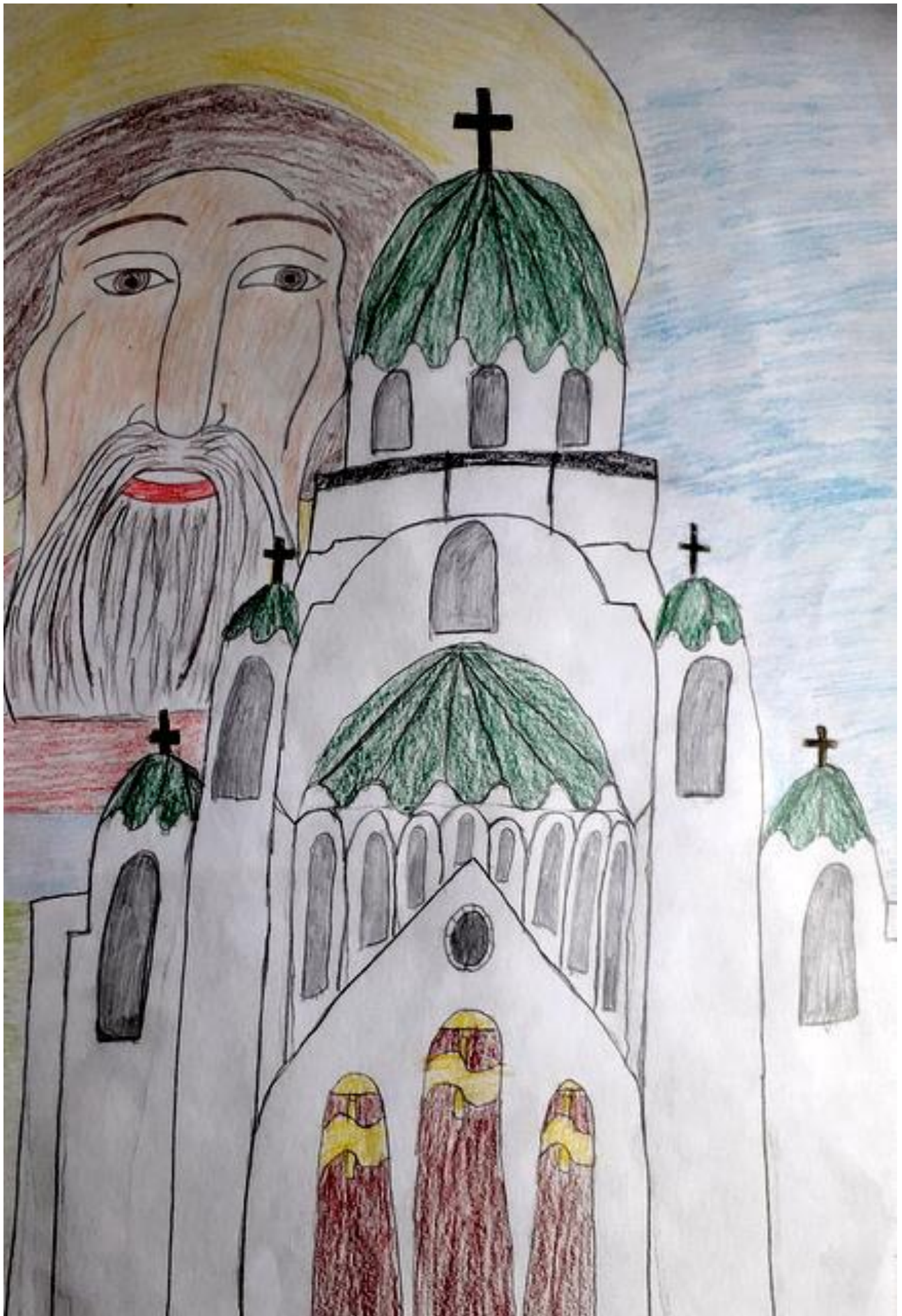
Урош Босанац Цз