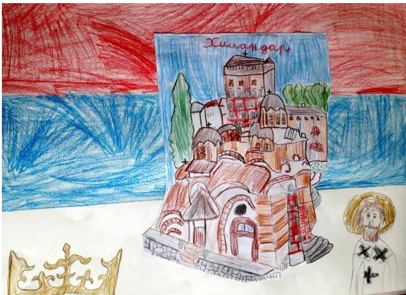
Сташа Веланац II 4