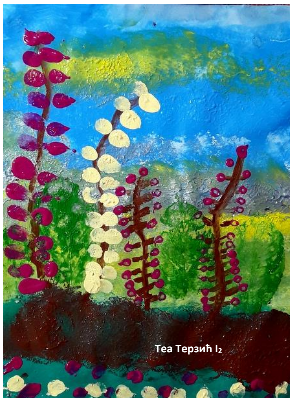
Tea Terzić I 2