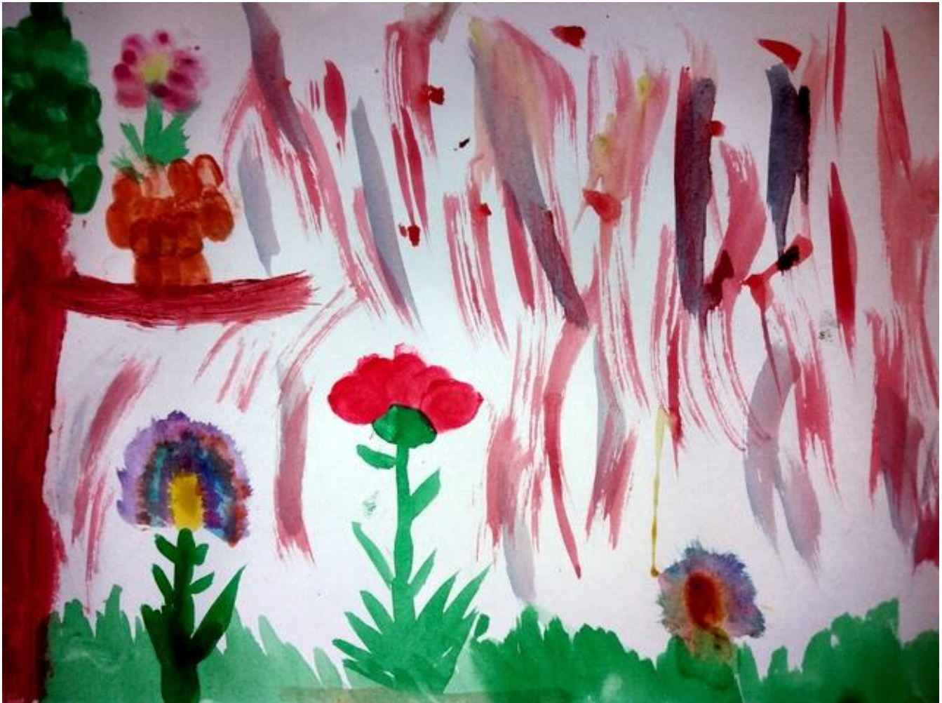
Нађа Сланкаменац I 2