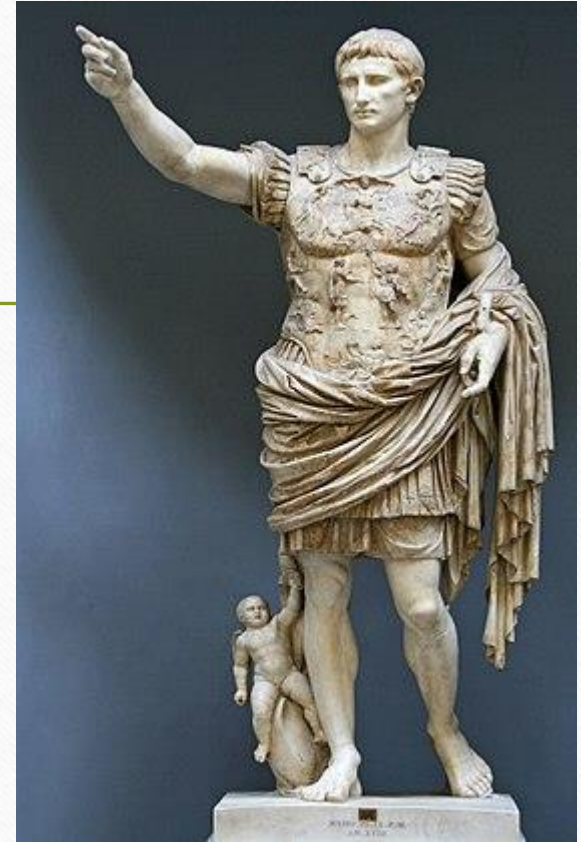
Augusto di Prima Porta. 1. век н.е. Musei Vaticani, Ватикан