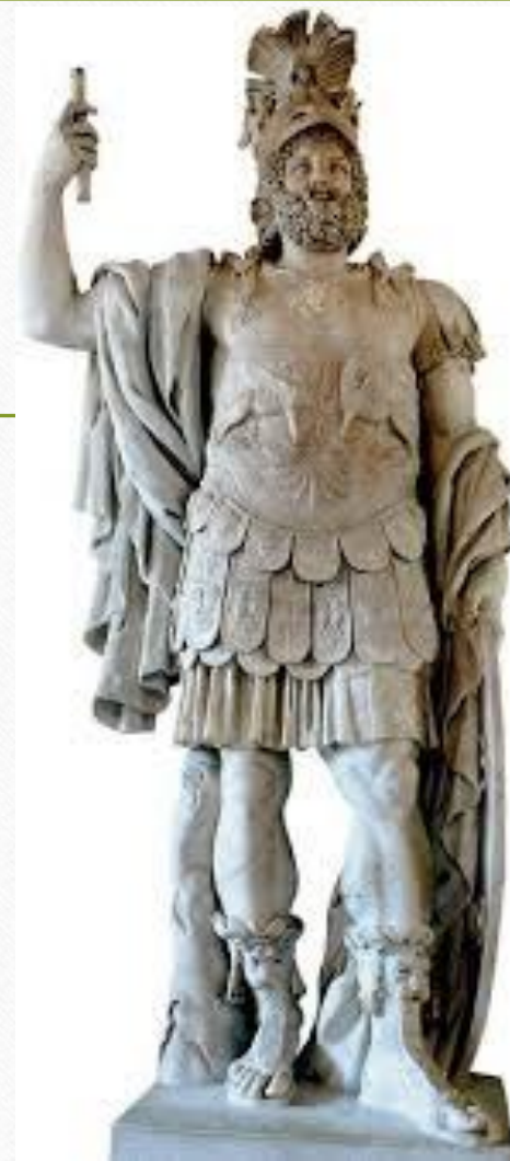
Колосална статуа Марса, Musei Capitolini, Рим, Италија