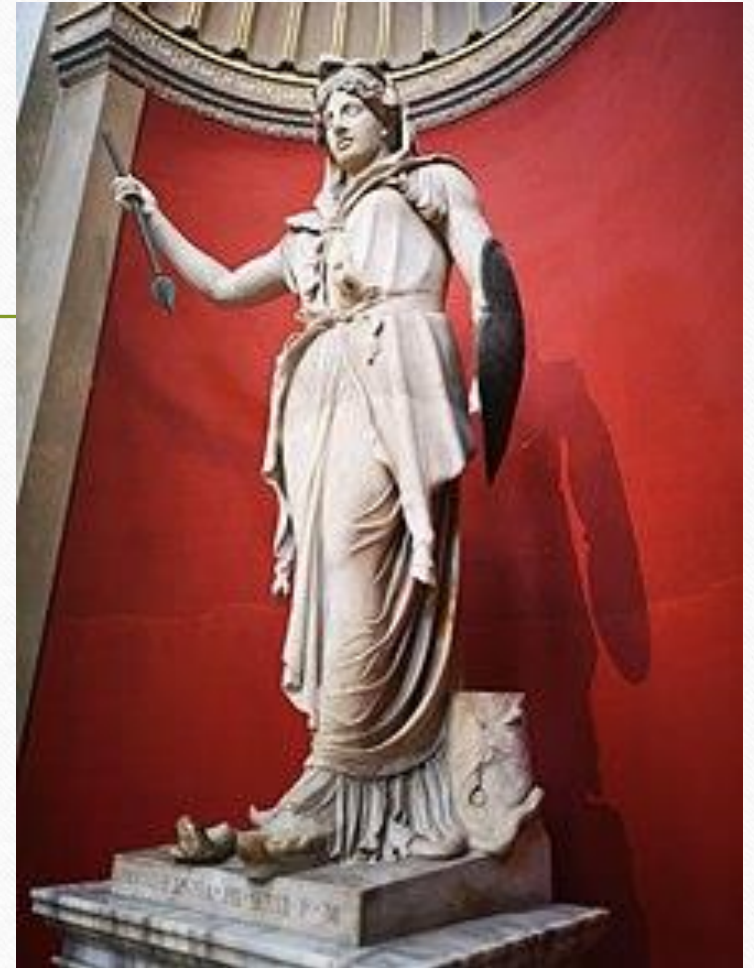
Juno Sospita, римска статуа, мермер, 2. век н.е. Musei Vaticani, Ватикан