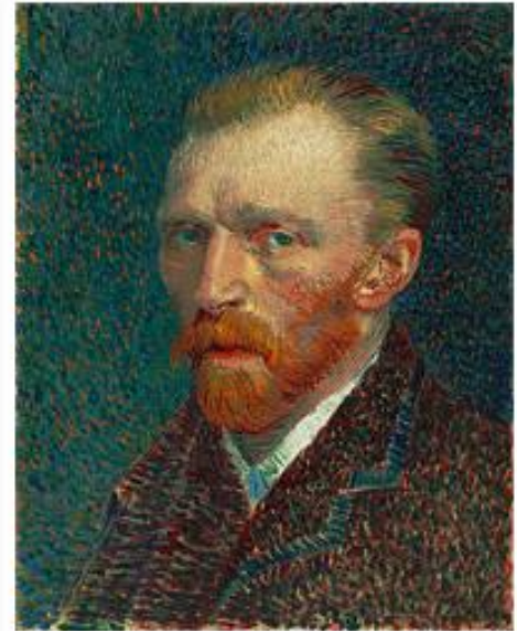
Vinsent van Gog

Слике које је Винсент ван Гог створио нису имале вредност за његовог живота, када је успео да прода само једну – „Црвени виногради“. Међутим, након његове смрти цене уметничких дела које је насликао почеле су нагло да расту.