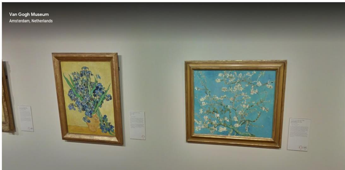
Van Gogh Museum Amsterdam, Netherlands