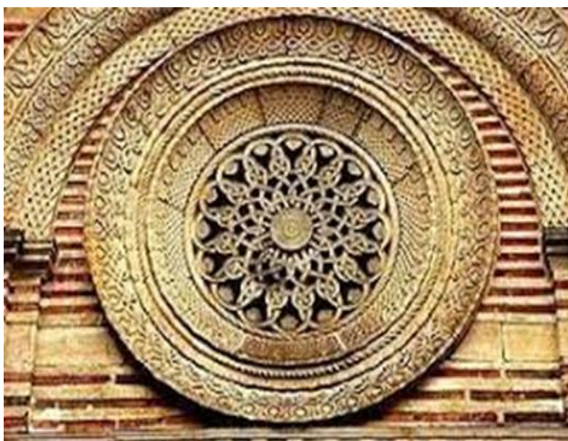
Орнамент из манастира Каленић