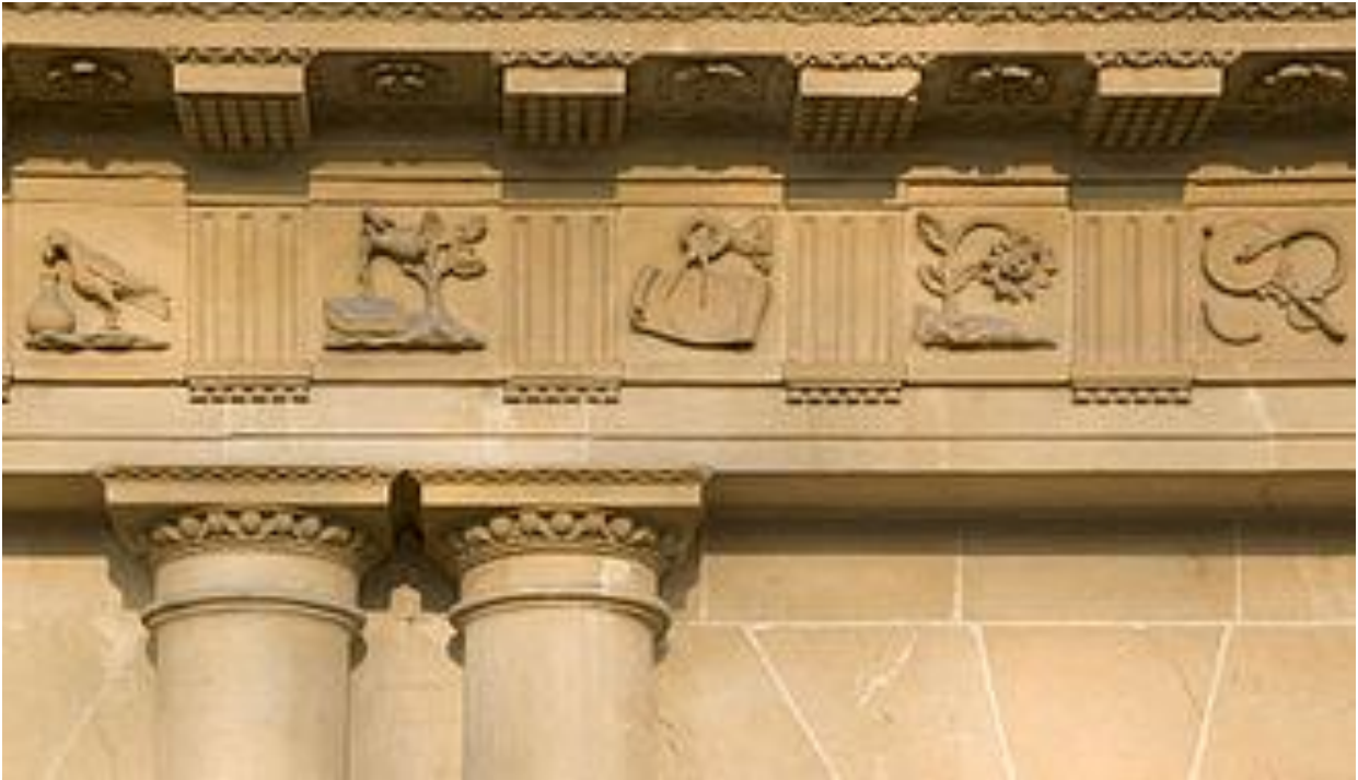
Пример грчког фриза