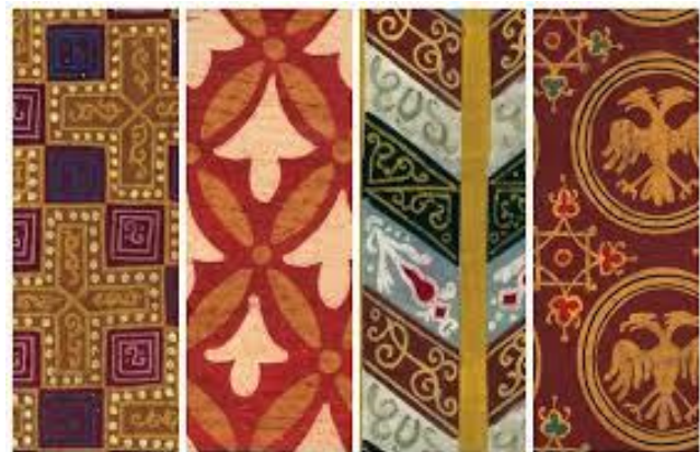
Пример српских орнамената