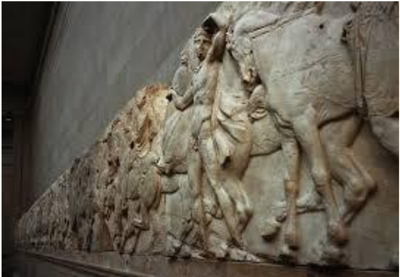
Пример фриза у Сједињеним Америчким Државама

Маниризам, такође познат као касна ренесанса, је стил у европској уметности. Стилски, маниризам обухвата различите приступе под којима утичу и реагирају на хармоничне идеале повезане са уметницима попут Леонарда да Винчија, једног од најпознатијих сликара свих времена.