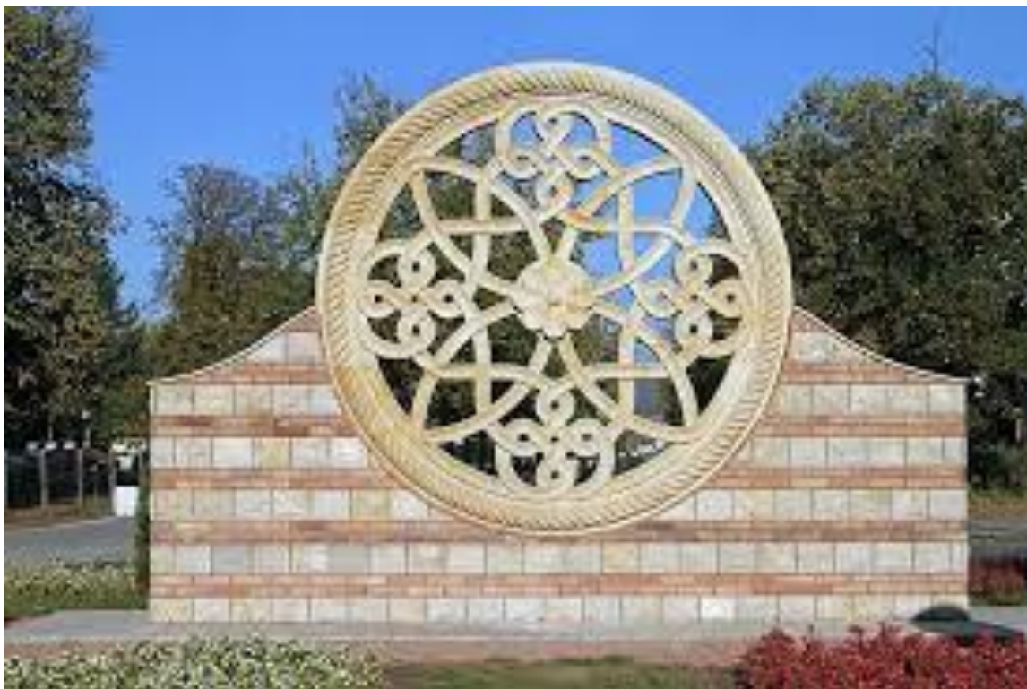
Розета на кружном току код касарне „Цар Лазар“ у Крушевцу

Израз ружичасти прозор није коришћен пре 17. века, а према Оксфордском речнику енглеског језика потиче од енглеског назива цвета ружа.