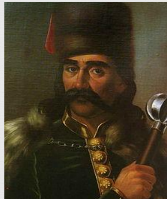
„Портрет Марка Краљевића“, насликала Мина Караџић