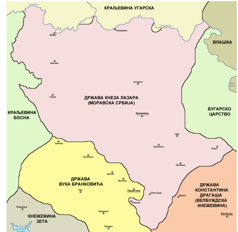
○ - Држава кнеза Лазара (Моравска Србија), у другој половини 14. века

Овде се види сво опирање Марка Краљевића, који би дао свој живот да његов народ победи, иако се борио на другој страни.