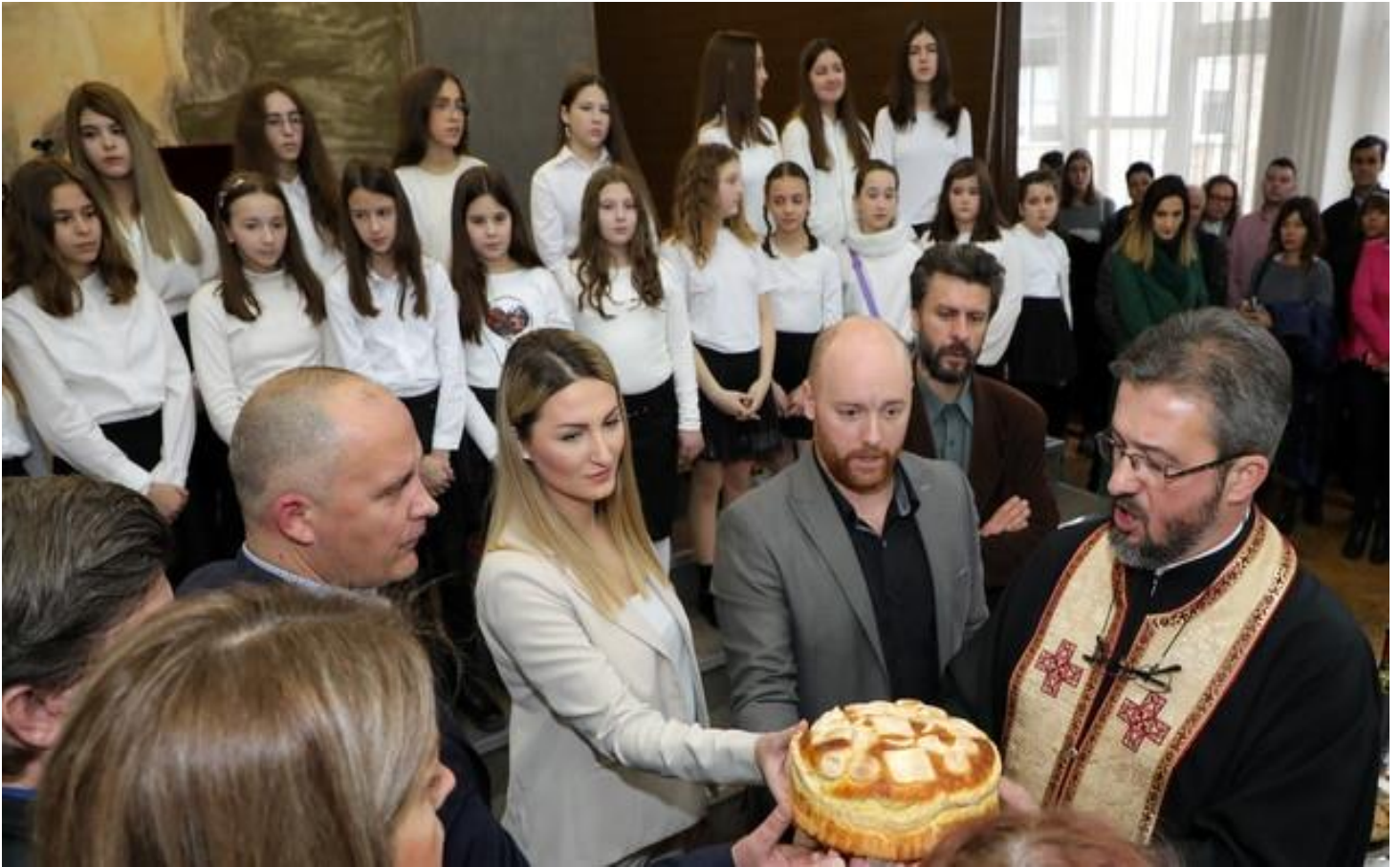
Прослава Светог Саве