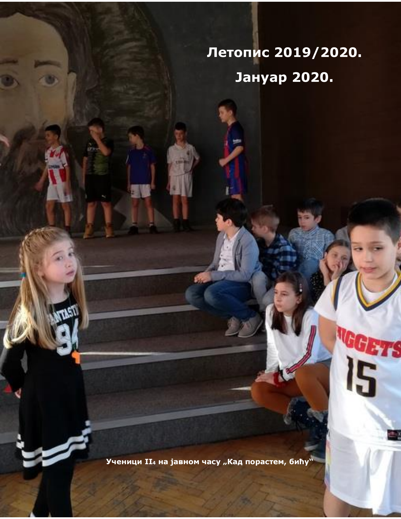
Ученици II 4 на јавном часу „Кад порастем, бићу“